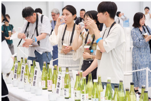
<全国日本酒フェア>